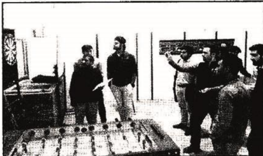
علوم وقت ارائه شد که بودجه لازم در اختیار دانشگاه ها قرار گرفت.

مدیرکل تربیت بدنی سازمان امور دانشجویان گفت: طبق مصوبه صندوق رفاه وزارت علوم قرار است در سال جاری ۱۰۰ خوابگاه دانشجویی مجهز به تجهیزات ورزشی و تندرستی شوند.