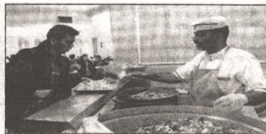
رئیس سازمان امور دانشجویان: