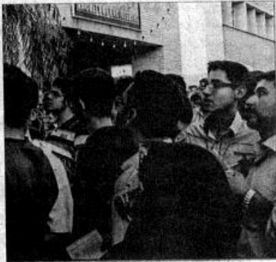
«مدظله العالی» در موضوع پذیرش دانشجو ۵ مؤلفه مانند ادارت آموزشی، رقابت‌های همگانی، سنجش علمی و فرصت برابر برای همه داوطلبان را در دستور کار قرار داده‌ایم.

رئیس سازمان سنجش آموزش کشور گفت: در سیاست‌های ابلاغی دو مؤلفه به برنامه‌های ما در حوزه پذیرش دانشجو اضافه شده که باید این مؤلفه‌ها را اجرایی کنیم. وی افزود: گسترش المپیادهای علمی ملی به سطح بین‌المللی یکی از برنامه‌های سازمان سنجش آموزش کشور است. خدایی ادامه داد: سیاست‌های ابلاغی مقام معظم رهبری «مدظله العالی» در مشخص کردن ساختارها سیاست‌ها و اقدامات و در بحث نظارت، ارزیابی اعتبارسنجی و تضمین کیفیت راهگشا هستند. رئیس سازمان سنجش کشور گفت: سیاست‌های ابلاغی مکمل نقشه جامع علمی کشور بوده و به همه مسئولین اجرایی کمک می‌کند که این نقشه را به سرعت و دقت بیشتری اجرایی کنند. وی افزود: با توجه به سیاست‌های ابلاغی، بحث پذیرش دانشجو در تحصیلات تکمیلی مورد بازنگری قرار می‌گیرد.