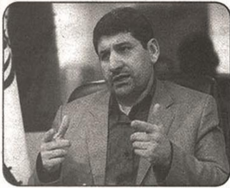
ایجاد می کند.

صدا و سیما نگران حجاب در دانشگاه ها شده در حالی که به خود نمی پردازد