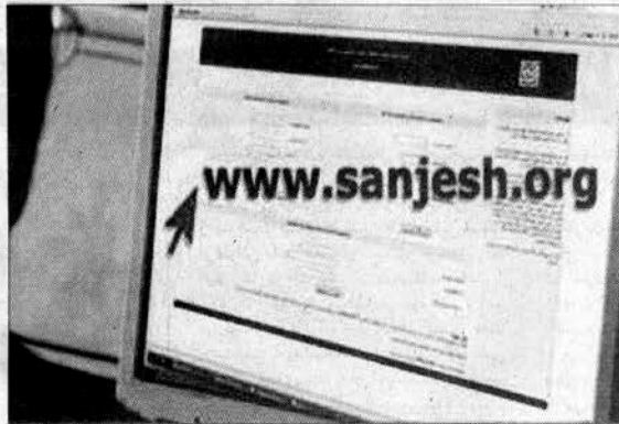
این آزمون برای رشته‌هایی که پذیرش آنها از طریق آزمون است، روز جمعه ۲۴ مردادماه برگزار می‌شود. مشاور عالی سازمان سنجش خاطرنشان کرد: بر اساس برنامه زمانی پیش‌بینی شده

مشاور عالی سازمان سنجش با بیان اینکه تا ساعت هشت صبح امروز ۵۷ هزار و ۴۲۱ نفر در این آزمون ثبت نام کرده‌اند و بر اساس برنامه زمانی پیش‌بینی شده این آزمون برای رشته‌هایی که پذیرش در آنها از طریق آزمون انجام می‌شود در روز پنجشنبه ۲۳ مردادماه برگزار خواهد شد.