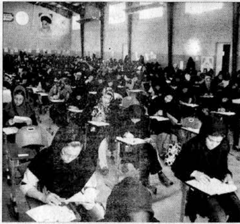
آموزش عالی و دانشگاه آزاد برای رشته های می گیرد، پنج شنبه ۲۳ مرداد در حوزه های که پذیرش در آنها از طریق آزمون صورت امتحانی مربوط تمام می شود.

دقیق آن نسبت به ثبت نام اقدام کند. توکنی افزود: داوطلبان واحد شرایط برای ثبت نام باید مبلغ ۱۴۴ هزار ریال به عنوان وجه ثبت نام به وسیله کارت های بانکی عضو شبکه شتاب که پرداخت الکترونیکی آنها فعال است بپردازند. مشاور عالی رئیس سازمان سنجش آموزش کشور تاکید کرد: آزمون کاردانی به کارشناسی ناپوسته سال ۱۳۹۳ دانشگاه و مؤسسات