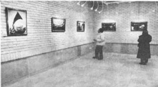
نمایشگاه نقاشی، عکس و کاریکاتور در دانشگاه شهید چمران اهواز گشایش یافت. نمایشگاه‌های یاد شده به نمایش گذاشته شده‌اند.

وی تصریح کرد: این نمایشگاهها از ۱۶ تا ۱۹ آذرماه صبح و بعد از ظهر آماده بازدید علاقه‌مندان است. کیانمش اتمه داد: مسابقات داستان مینی مالیستی (داستان کوتاه کوتاه) و شعر دانشجویی نیز با محوریت زندگی دانشجویی نیز از جمله برنامه‌های گرامیداشت روز دانشجو می‌باشد. مسوول دبیرخانه معاونت فرهنگی، اجتماعی دانشگاه شهید چمران اهواز اضافه کرد: بخش فیلم، اهدای جوایز و تقدیر از شرکت‌کنندگان و هنرمندان آثار ارائه شده از جمله دیگر برنامه‌ها است.