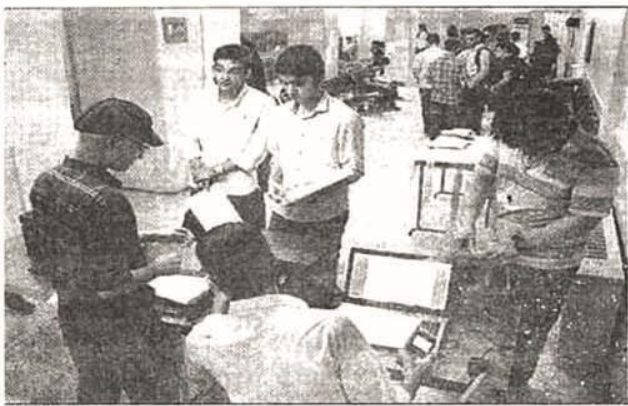
می برد. همچنین دانشجویانی که به دلیل مشکلات موجود موفق به انتخاب واحد نشده اند، می توانند روز شنبه (۹ بهمن ماه) اقدام به انتخاب واحد کنند. نورخوزستان پنجشنبه ۷ بهمن

معاون آموزشی دانشگاه را طراحی کرده است، رفع شد.