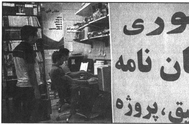
علوم و دستگاه‌ها را مشخص کرده و از نظر قانونی تأکید شده که با این شرکت‌ها برخورد

به گزارش مهر، چندی پیش لایحه ماده واحده مقابله با تقلب در تهیه آثار علمی در راستای سیاست‌های وزارت علوم و به منظور مقابله با تقلب در تهیه آثار علمی، به منظور ارائه به مجلس شورای اسلامی به تصویب هیات وزیران رسید. نورخوزستان ۹۴/۰۶/۲۵