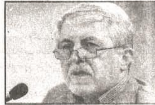
معاون آموزشی وزیر علوم خبر داد ابلاغ آئین‌نامه بازنگری شده دوره دکتری به زودی