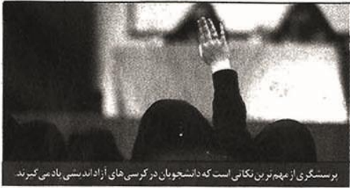
بررسی‌گری از مهم‌ترین نکاتی است که دانشجویان در کرسی‌های آزاداندیشی بادی می‌گیرند

معاون وزیر علوم: درباره کرسی‌های آزاداندیشی صحبت نمی‌کنم