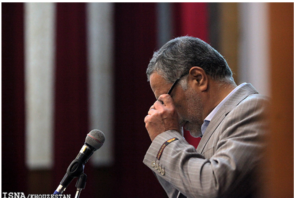
ISNA / KHOUZESTAN