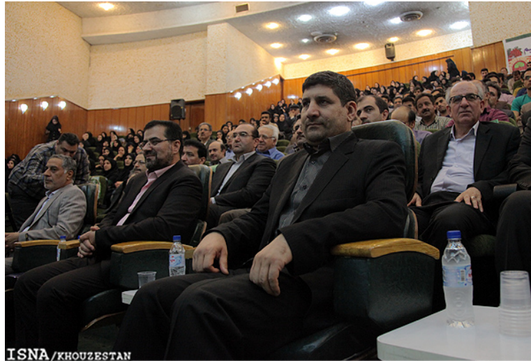
ISNA / KHOUZESTAN